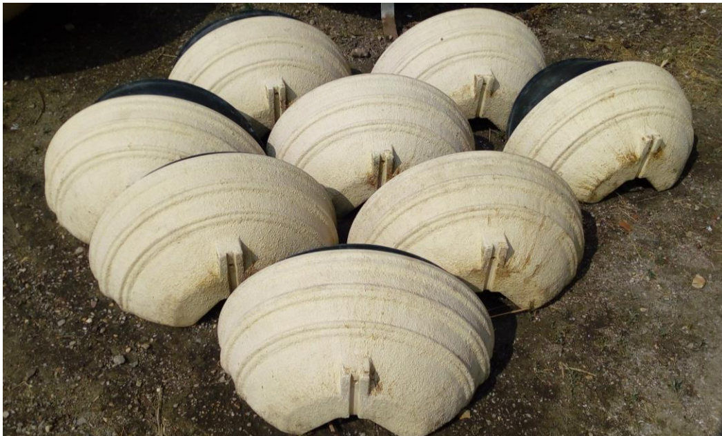
Lot n°11 : Pots suspendus