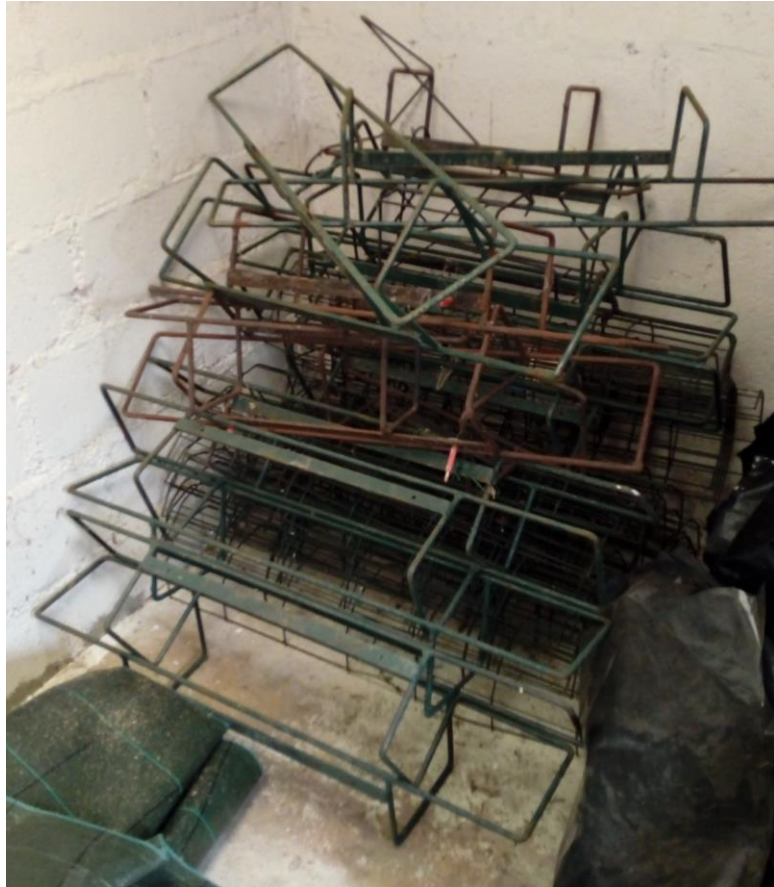
Lot n°4 : Supports de jardinières