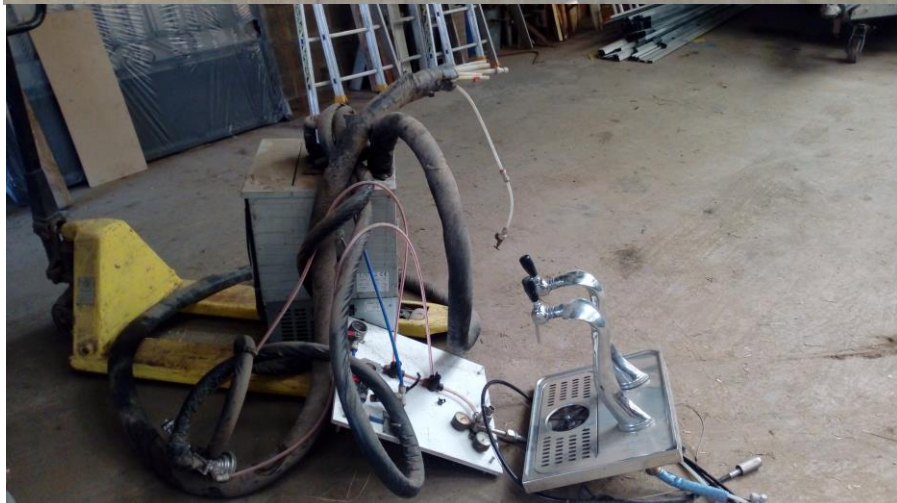
Lot n°12 : Machine à bière