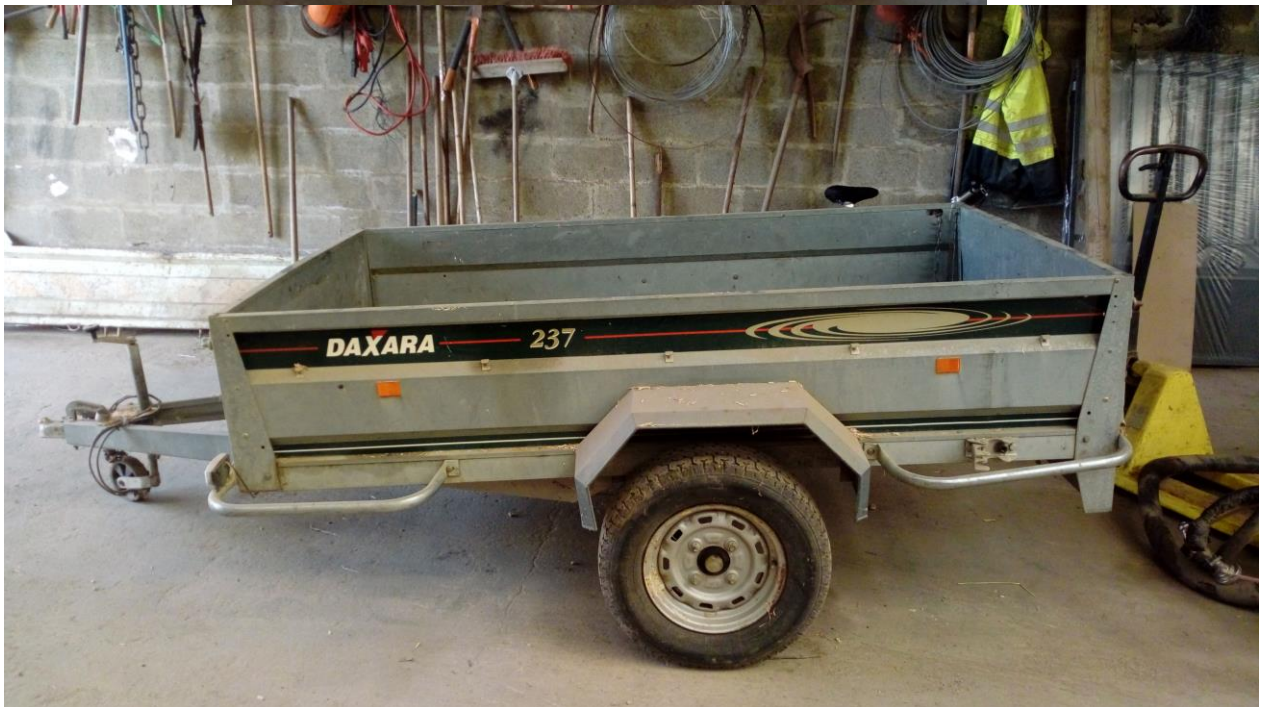
Lot n°13 : Remorque 500 kg (essieu HS)