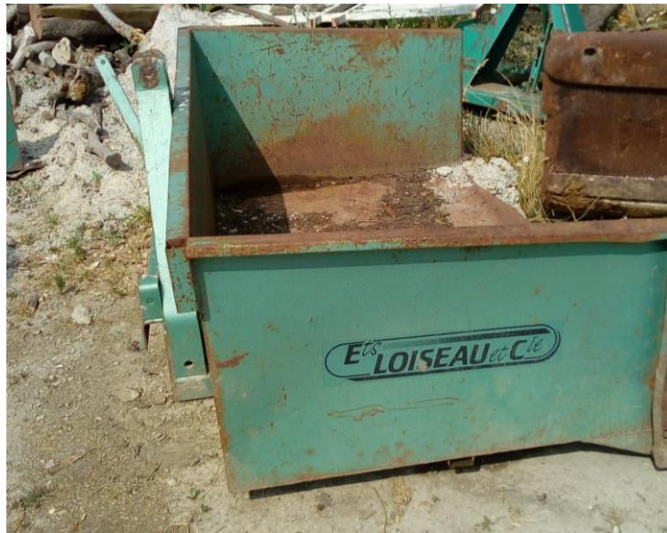
Lot n°6 : Bennette portée n°1