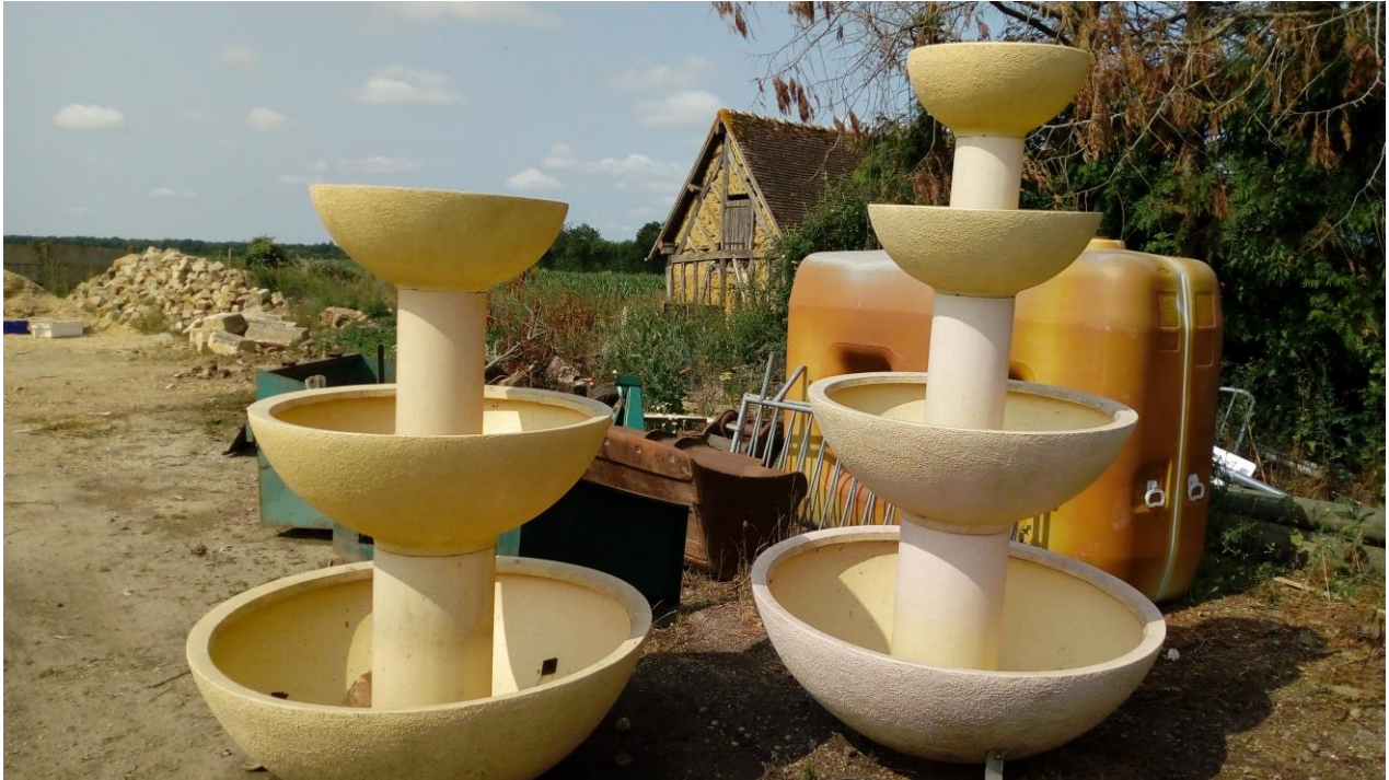
Lot n°10 : Cascades à fleurs