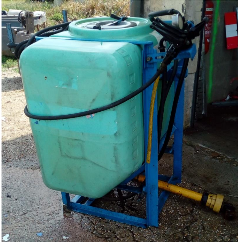
Lot n°14 : Tonne de traitement portée