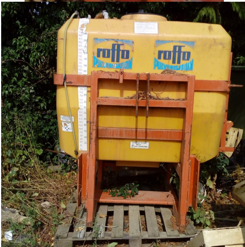
Lot n°9 : Tonne de traitement avec moteur