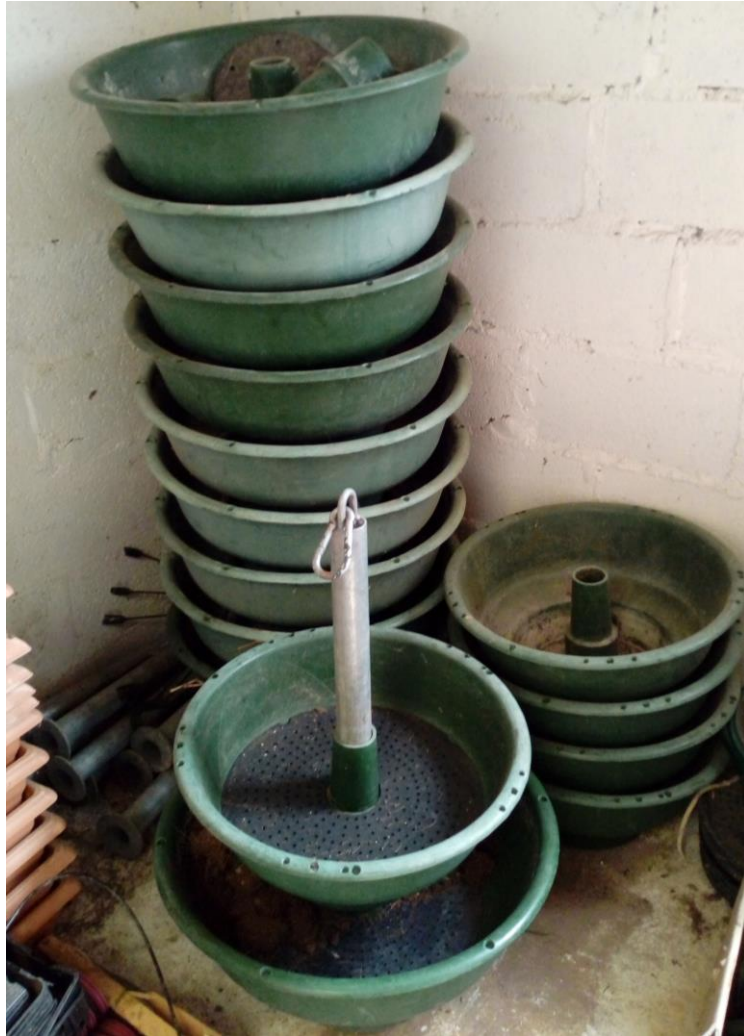
Lot n°3 : Pots suspendus