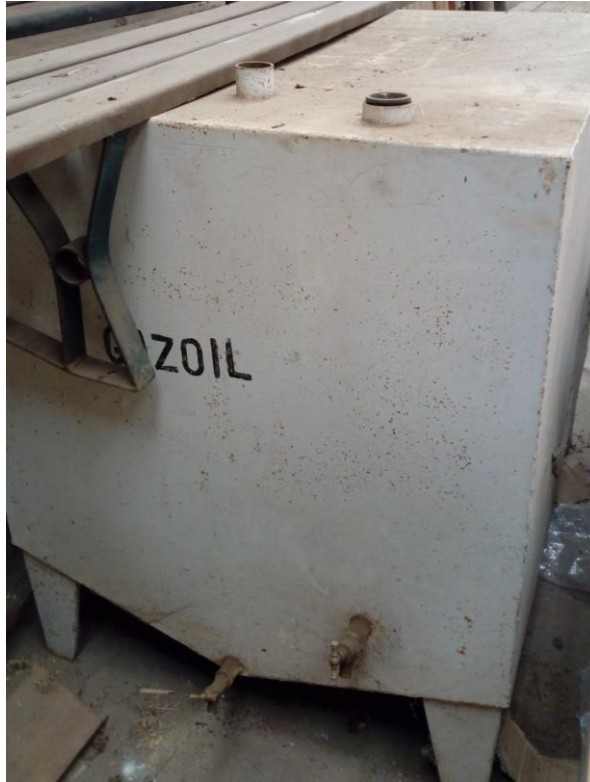
Lot n°18 : cuve à fioul