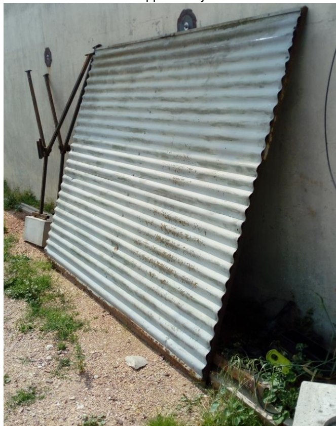
Lot n°5 : Garage préfabriqué