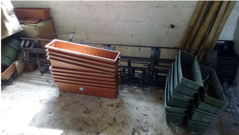
Lot n°2 : Lots de jardinières et supports