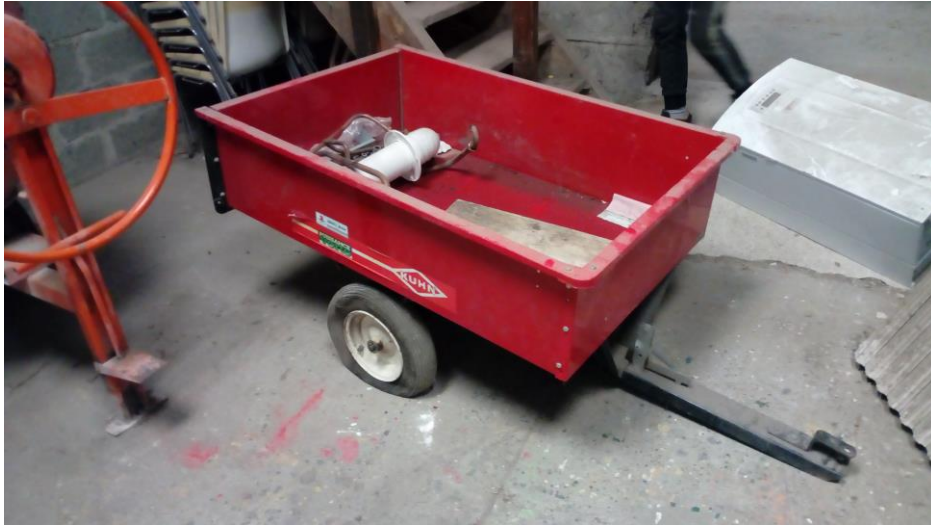
Lot n°1 : Remorque de micro-tracteur