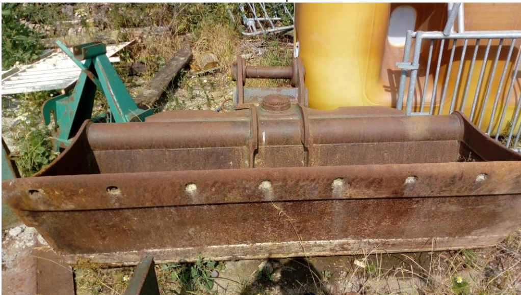
Lot n°7 : Godet à restaurer