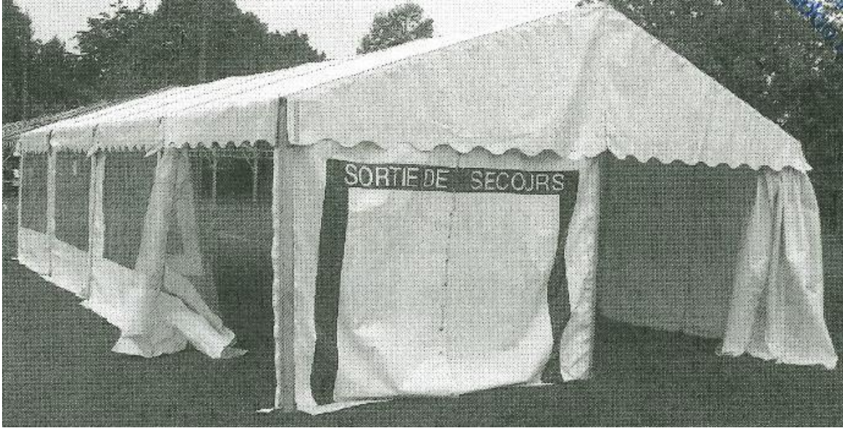
Lot n°16 : tente 6m x 12m