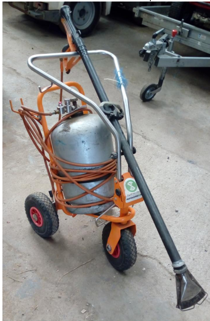
Lot n°15 : Brûleur